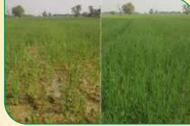
पैडी मल्टीन्यूट्रियंट के पहले कल्ले | पैडी मल्टीन्यूट्रियंट के बाद कल्ले