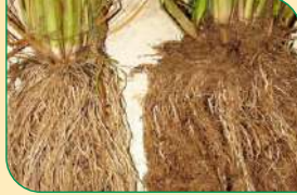
सामान्य जड़ | पैडी मल्टीन्यूट्रियंट जड़

पैकिंग : 100 मि.ली., 250 मि.ली., 500 मि.ली. और 1000 मि.ली.