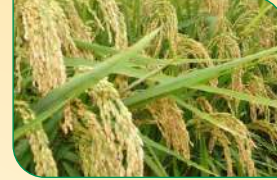
पैडी मल्टीन्यूट्रियंट से बहतर उपज