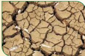
मिट्टी, ह्यूमाजोन-98 के प्रयोग से पहले

पैकिंग : 100 मि.ली., 250 मि.ली., 500 मि.ली. और 1000 मि.ली.