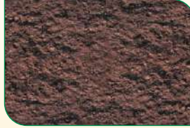
मिट्टी, ह्यूमाजोन-98 के प्रयोग के बाद