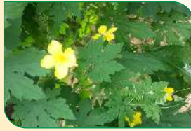
पोषक तत्वों को बढ़ाता है

नाइट्रो पावर में पौधे के फल, फूल के बढ़ाने और पोषक तत्वों के अवशोषण प्रक्रिया में सहायता करता है। मात्रा : 2 से 5 मि.ली./लीटर पैकिंग : 250 मि.ली.