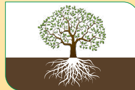
गुणवत्ता एवं अधिक उपज