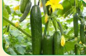
अधिक शाखाएं एवं फल फूल