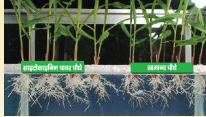
साइटोकाइनिन पावर पौधे