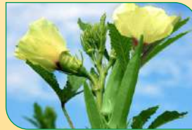
पोषक तत्वों को बढ़ाता है

अमीनो गोल्ड जड़ों और अंकुरण क्षमता को बढ़ाता है और पौधे में सूक्ष्म एवं अति सूक्ष्म पोषक तत्व की अवशोषण क्षमता को बढ़ाता है। मात्रा : 2 से 5 मि.ली./लीटर पैकिंग : 100 मि.ली., 250 मि.ली.