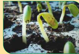
अंकुरण क्षमता को बढ़ाता है