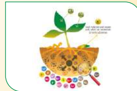
पोषक तत्वों को बढ़ाता है