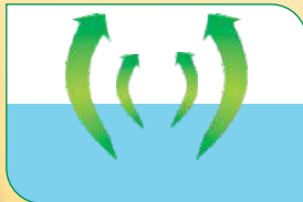
पोषक तत्वों की अवशोषण क्षमता